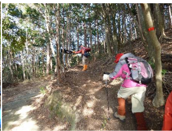
林道から登山道へ