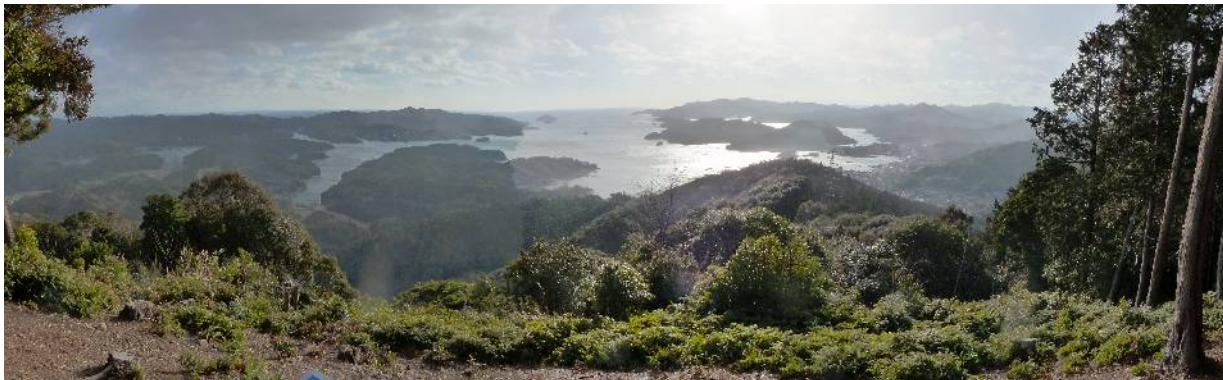
下: 馬山山頂からの五ヶ所湾展望