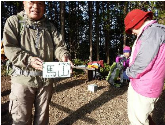
左: 馬山山頂(三角点有)