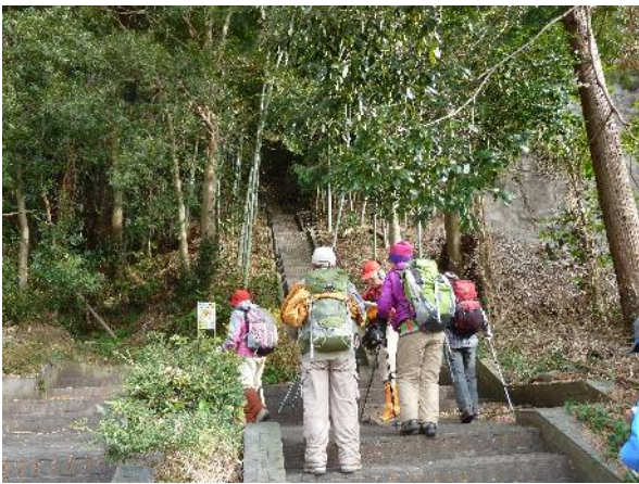
駐車場からすぐ階段を上る