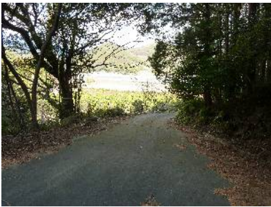
登山口 堤防を望む