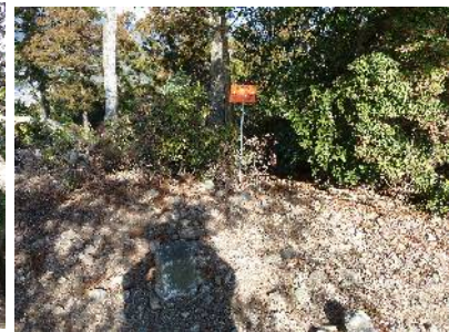
鶴路山頂(三角点あり)