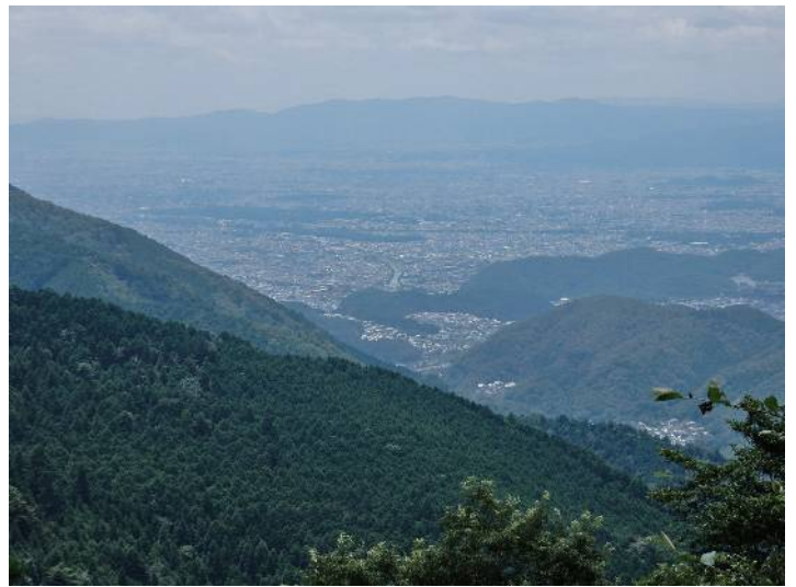
食事休憩場所より京都市街方面