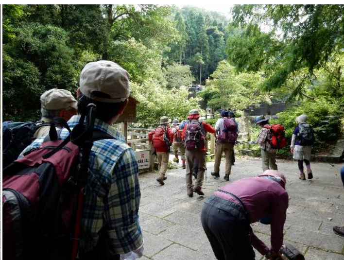
きらら坂の登山口