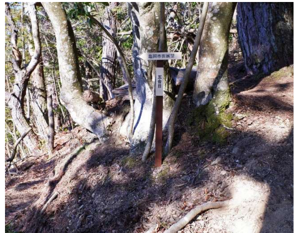
五合目の市街展望所