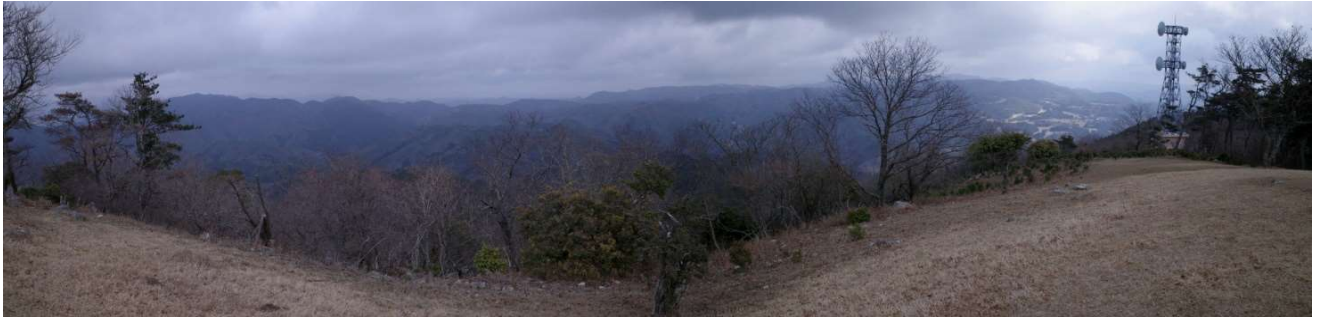
大野山山頂からのパノラマ