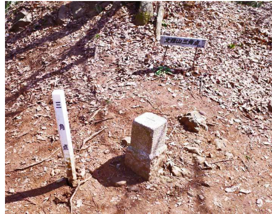
山名：奥の院350.4m、 点名：文殊山 の二等三角点