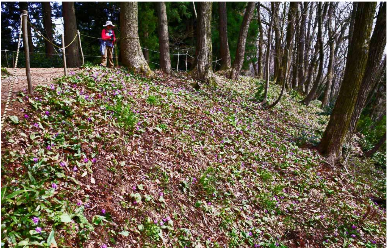
カタクリの花群生地