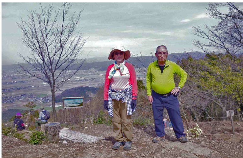
文 殊 山 に て