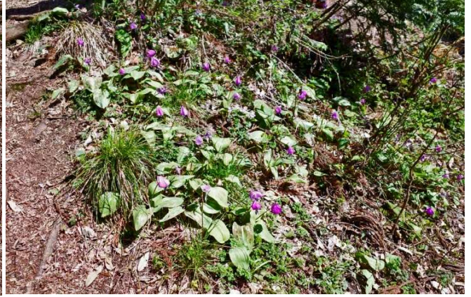
登山道のカタクリの花