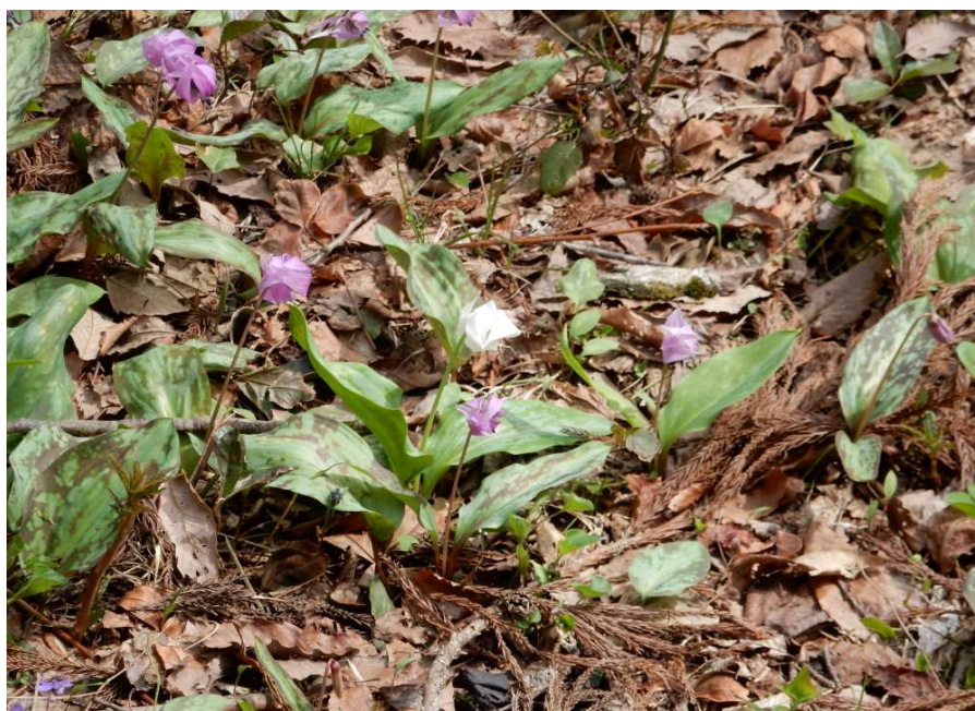
白 い カ タ ク リ の 花