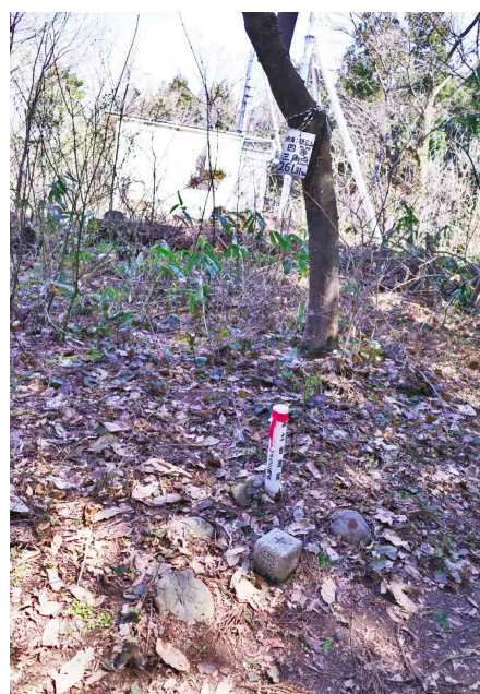
橋立山の四等三角点