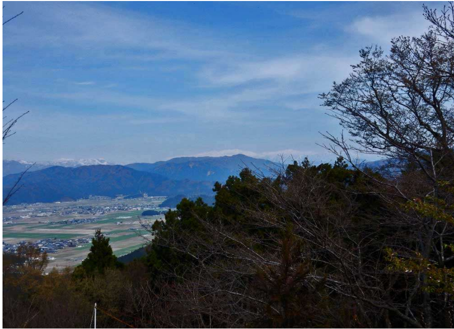
文殊山より白山連盟