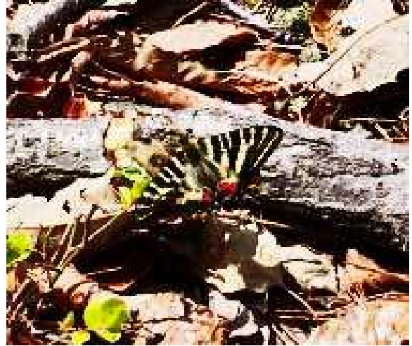
ギ フ チ ョ ウ