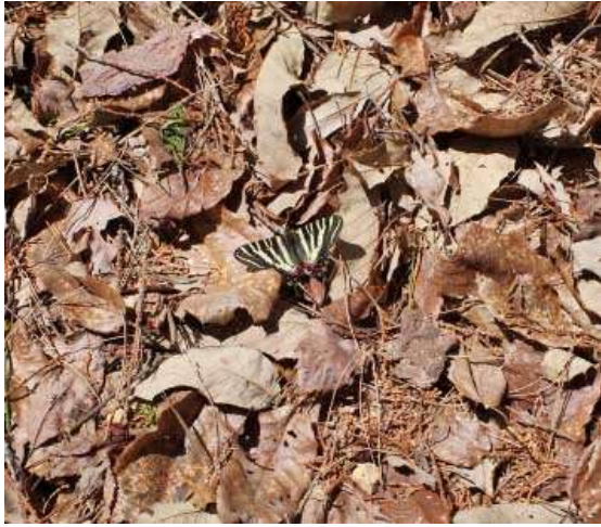
ギ フ チ ヨ ウ