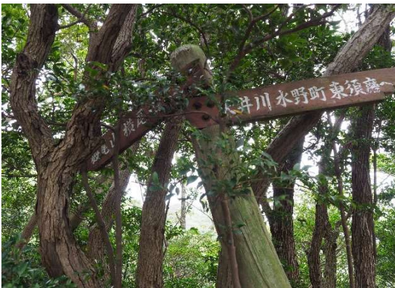
梅尾山手前の標識

八幡神社で一息ついて駅に向かう、熱いのでかき氷が食べたくなるが我慢して街中に入り商店街の道を抜けて板宿駅に、駅は地下に有り神戸地下鉄と山陽電車があり山陽電車側に入り阪神電車で元町に向かった。