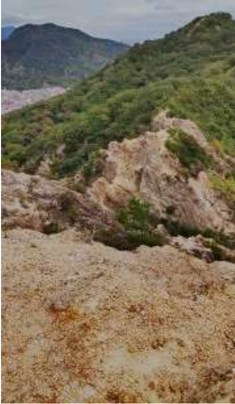
馬の背を見下ろす