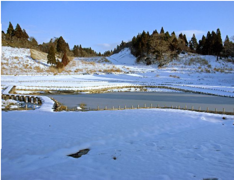
八雲横のスキー場跡(池が作られている)