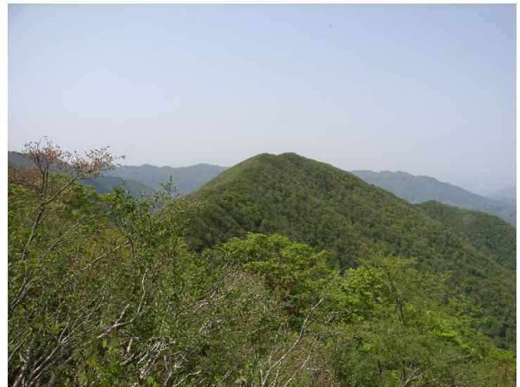
大秀山より双子穂の国見岳