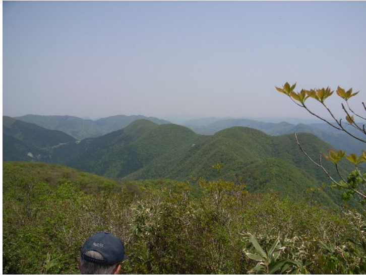
静馬ヶ原より伊吹山北尾根を望む