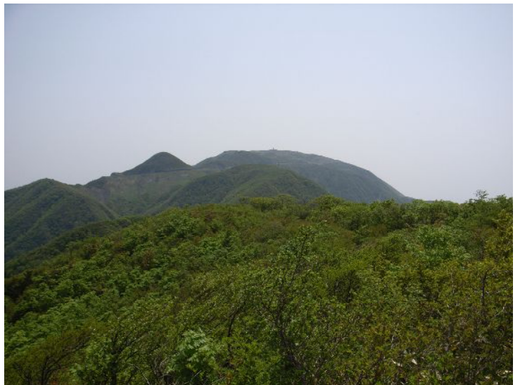
御座峰手前より伊吹山を振り返る