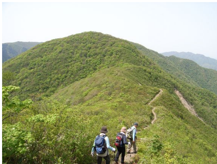
御座峰より大秀山を目指す