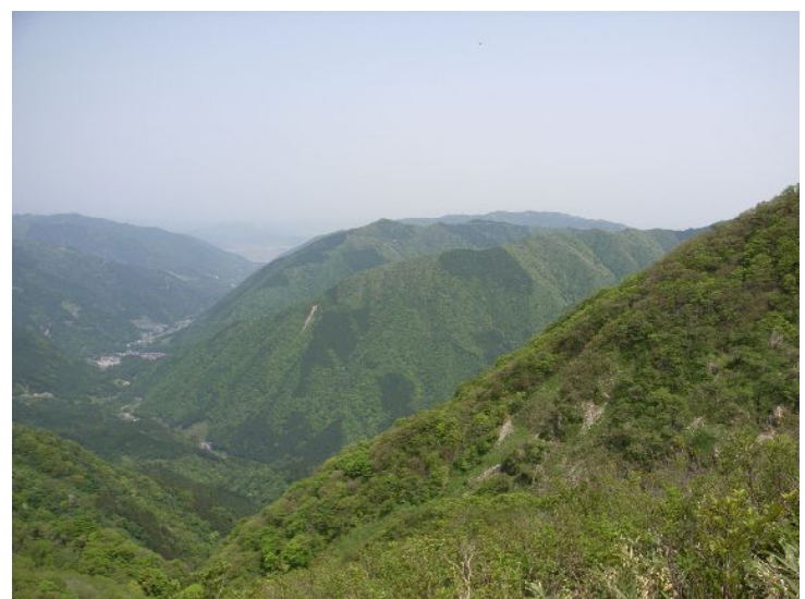
国見岳より春日方面を望む、右側は池田山方面を望む