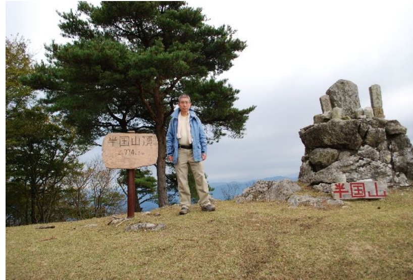
半 国 山 山 頂