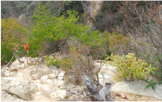
芦屋ロックガーデン