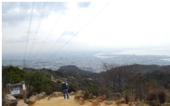
風吹岩から大阪湾