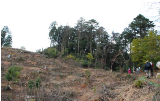
要害山(山頂に登っても標識も無い)