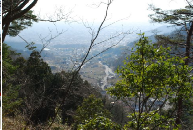
山中より甲府市街