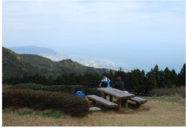
満観峰より駿河湾