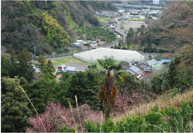
林道より花沢の里駐車場を望む