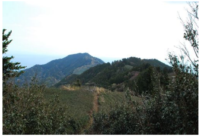
満観峰より日本坂から花沢山