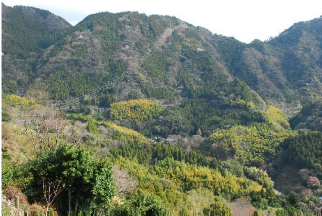
日本坂と法華寺を望む