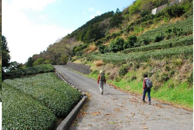
駐車場より同行した二人