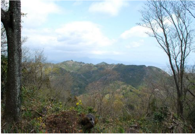
高草山分岐より満観峰を望む