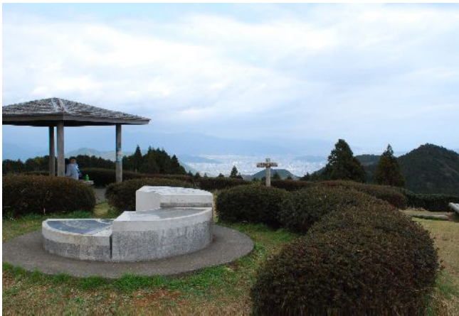
満観峰より日本平(晴れていれば富士山が)