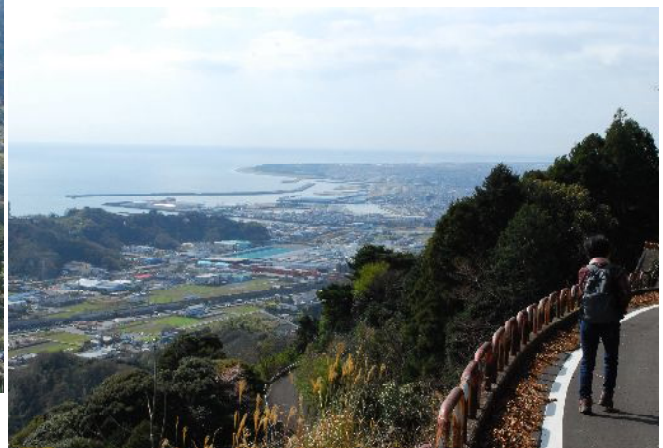
焼津漁港と焼津の町