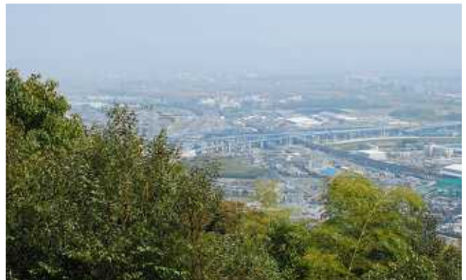
旗立松の展望台より大山崎JCT