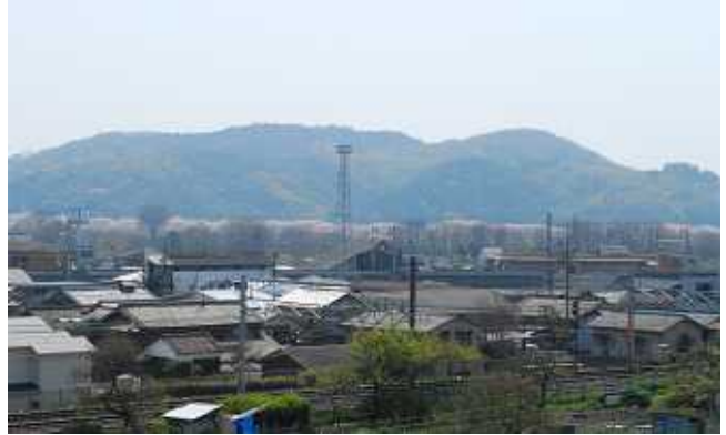
山崎聖天前より淀川堤防の桜と男山を望む