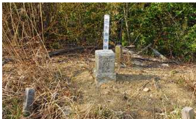
向谷山(大沢山の三角点)