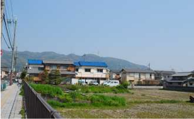
自宅付近より天王山を望む