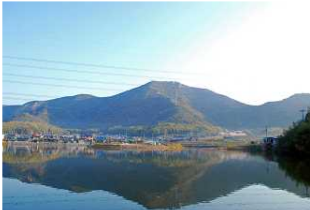
新池より高御位山