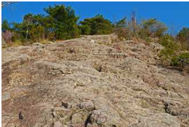
きつい勾配の岩場