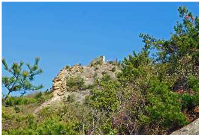
高御位山を見上げる