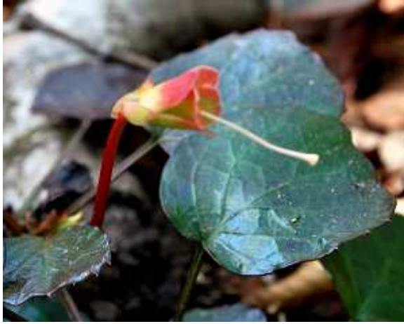
不明(トクワカソウと思われる)