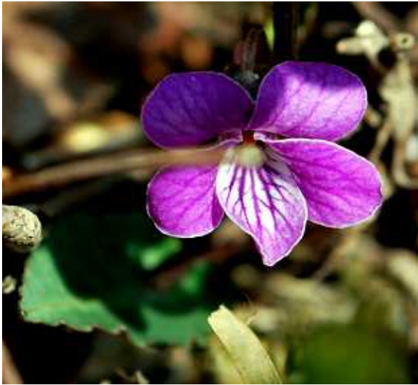
ト ク ワ カ ソ ウ