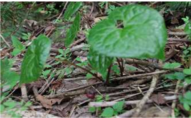
フ タ バ ア オ イ