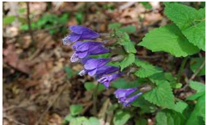
ラショウモンカズラ