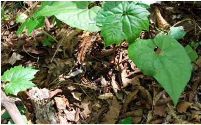
ウ ス バ サ イ シ ン