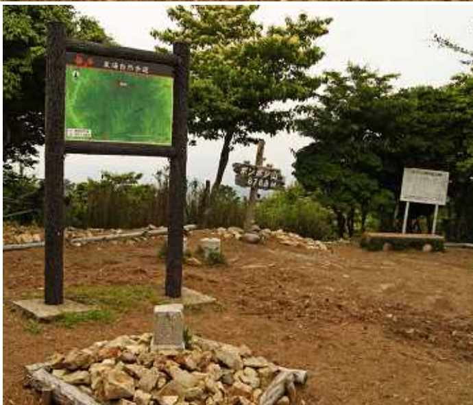
ポンポン山の山頂