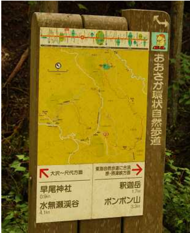
右写真:大沢ポンポン山登山口標識

2009年07月03日 我が町最高峰 釈迦岳(540m)とポンポン山(681m) 単独行