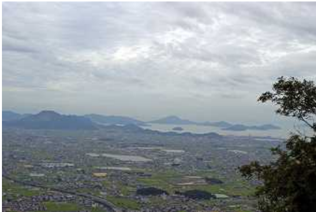
展望台より瀬戸内海