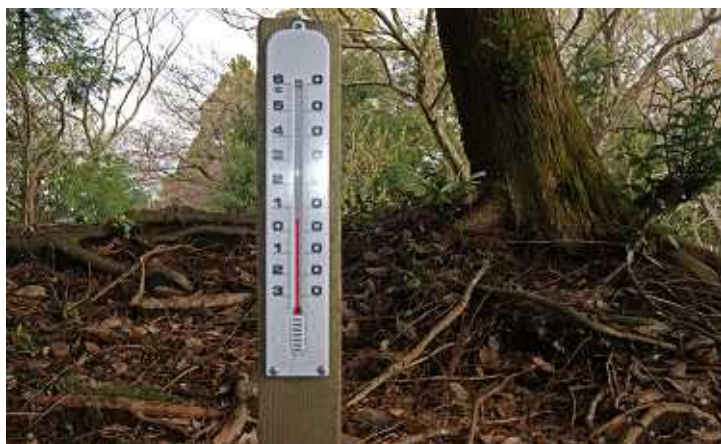
高草山山頂の寒暖計( 5度を示している)