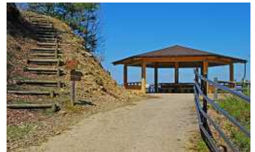
【写真】 雲海展望台より竹田城跡

自然学校本館前に案内板があり幾つかのコースがあるが不安なので地形図にある登山道がくまコースと同じようなのでくまコースに行くことにする。12時34分登り始める、林道で土道の登山道はないようである、林道終点に13時12分到着する 雲海展望台が作られている。