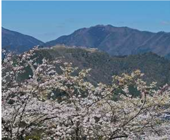
【写真】 立雲峡より竹田城跡

立雲峡の案内板には朝来山の山頂へ行ける道は表示されていない。立雲峡のに入り竹田城跡を見える所を探しに上部へ登っていく。上に登って行くが昇り過ぎると雑木林に入ってしまう眺望が利かなくなる。立雲峡内で竹田城跡が見えるのは同じ高さでしか見られなかった。