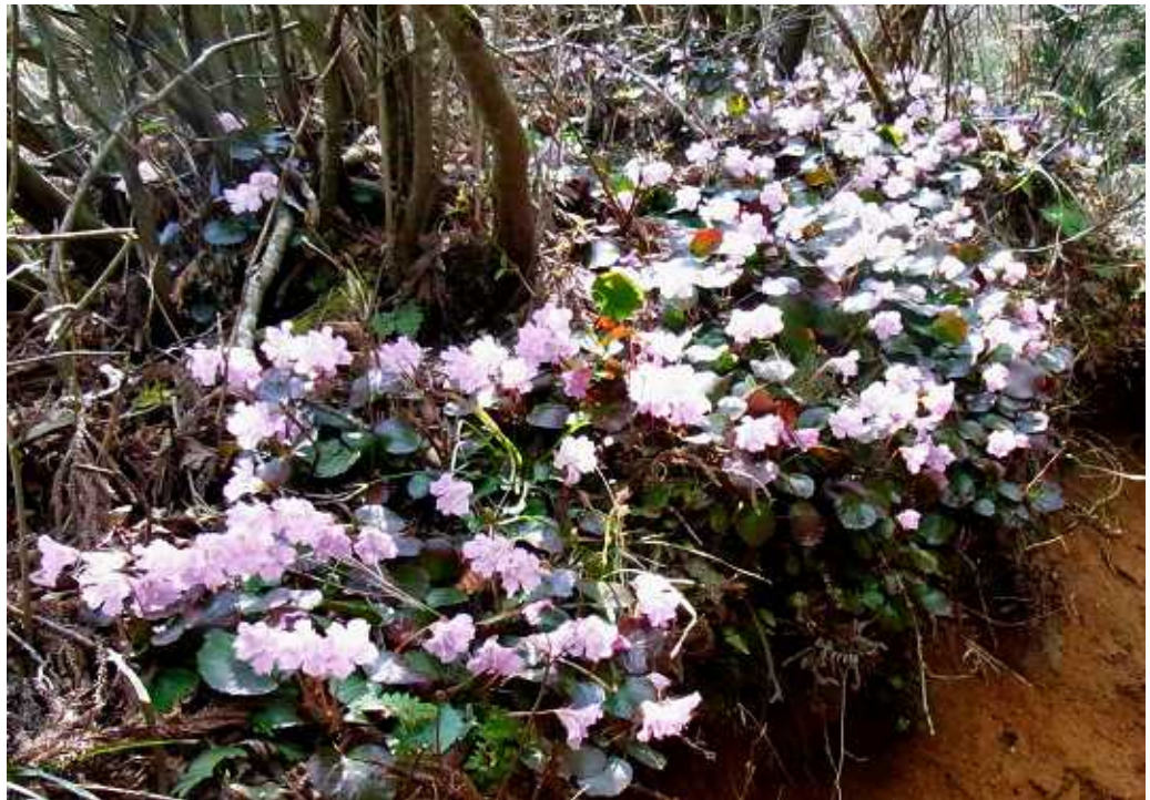
(写真 2点) トクワカソウ