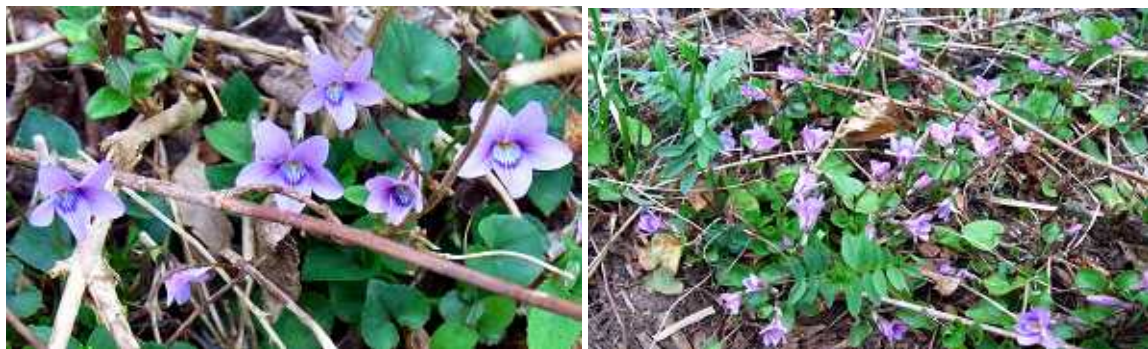
(写真) ミヤマスミレ

例年と比べて観られる花の種類が少ない、カタクリの花も蕾や花が開ききって居ないものばかりであったが、座禅草が一輪咲いているのが観られた。