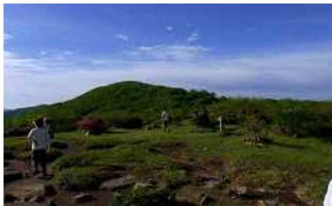
烏帽子山の方位板