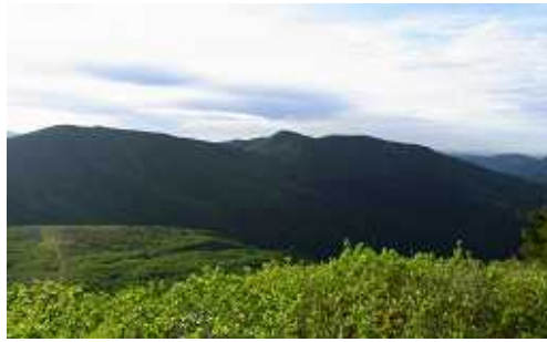
(写真) 下が大善原、左上が烏帽子山 右側が比婆山御陵

国民宿舎から大善原まで花の数は少なかった、色々な花が咲いていると期待していたが花に関しては期待はずれだった。