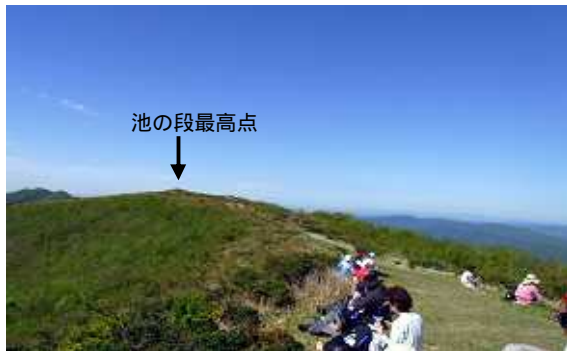
(写真) 池の段 と 方位板

比婆山御陵を先に進み池の段へ9時4分到着、360度の展望がある。 着いた所に方位板があるが最高地点はもう少し先のである。