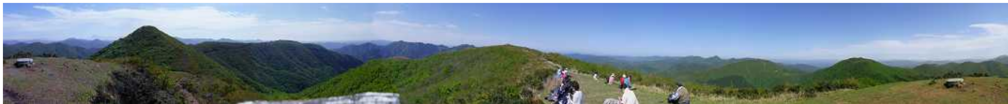
池の段からの360度パノラマ