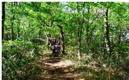
(写真) ぶな林の比婆山へ