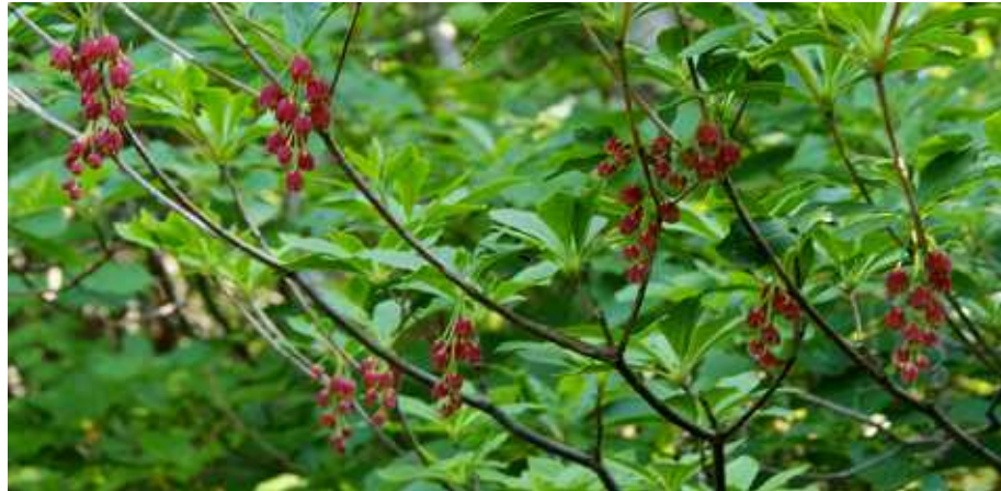
3点ともベニドウダン