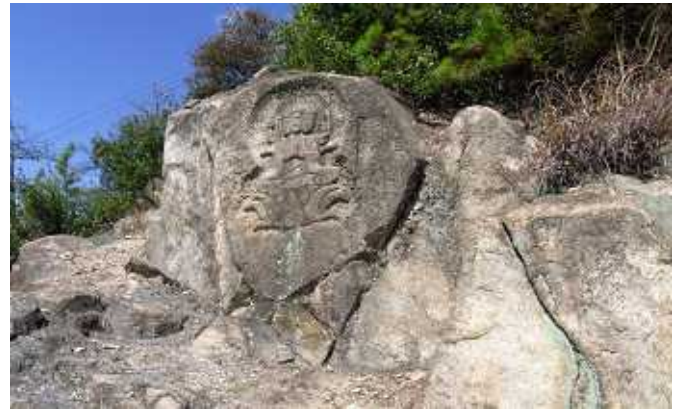
(写真 下) 黒滝山