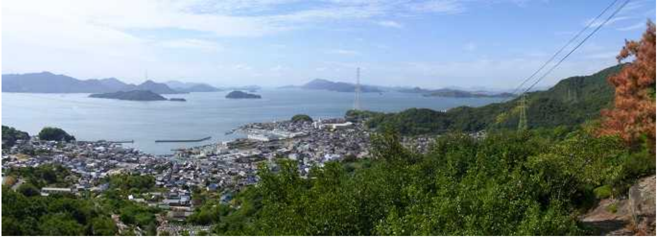
(写真) 忠海沖の大久野島と小久野島