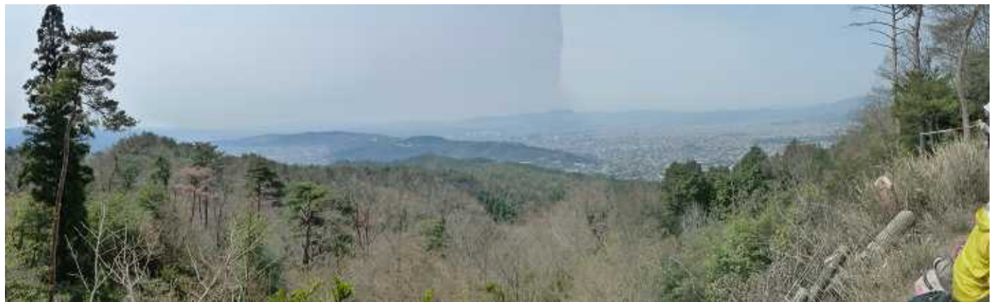
大文字山より京都市街