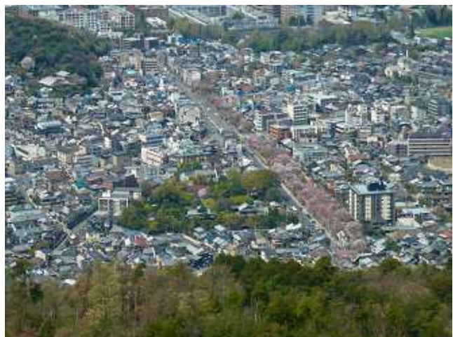
大文字火床より白川疎水