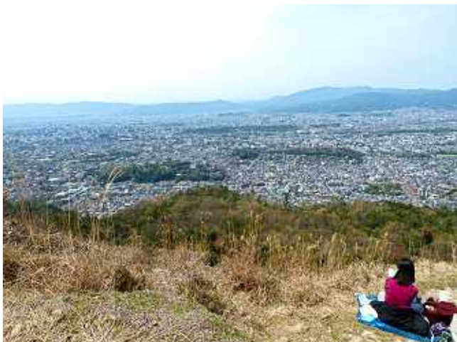
大文字火床より京都市街