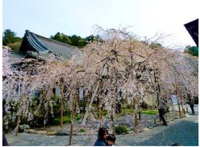
毘沙門堂の枝垂桜