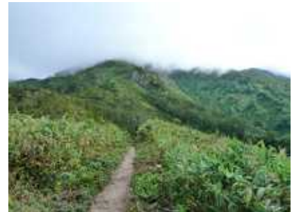
前方の東方向 ガスガ