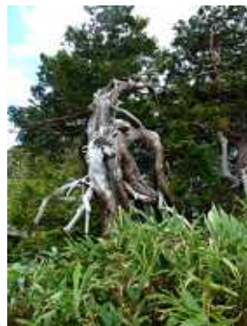
老木化した松と思われる