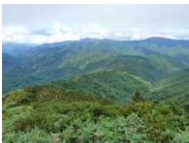
六本松、杉峠、赤兎方向