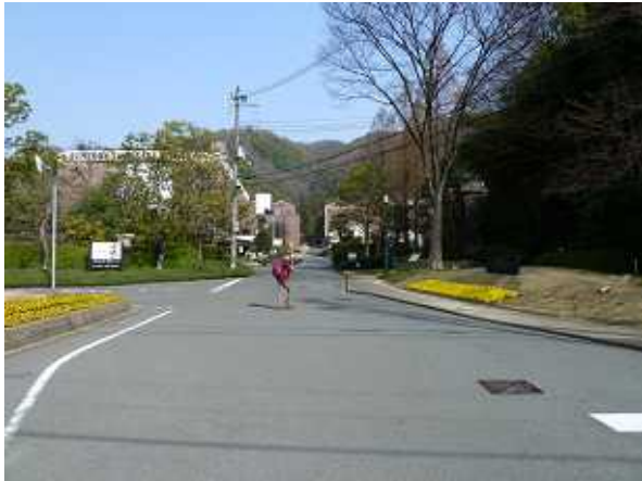
* サントリー山崎蒸留所入口 * 登山道渡渉