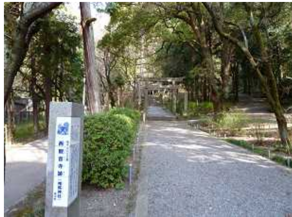
* 椎尾神社入口 * 天王山山頂