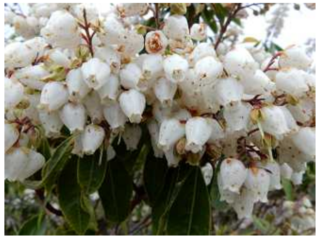
馬酔木の花が残っていた