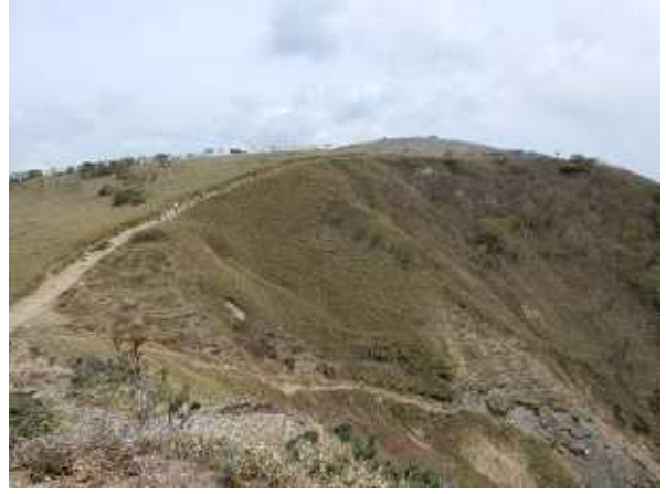
小女郎峠高台より蓬萊山方面