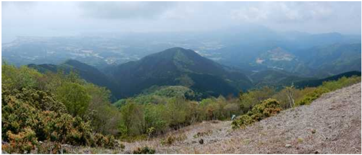
権現山より霊仙山方面