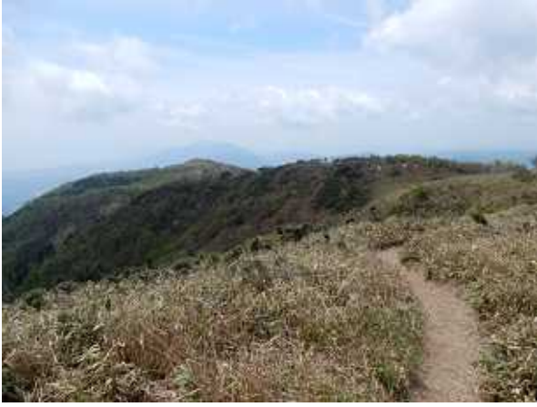
小女郎峠高台よりホッケ山方面