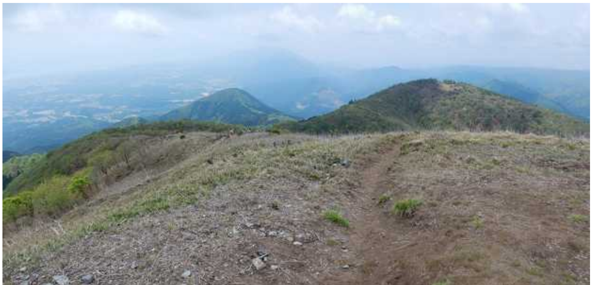
ホッケ山より権現山方面