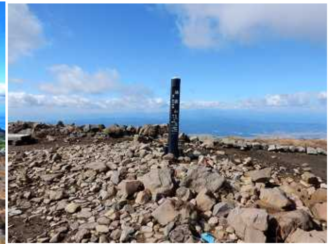
地藏岳山頂(標識は地藏山)