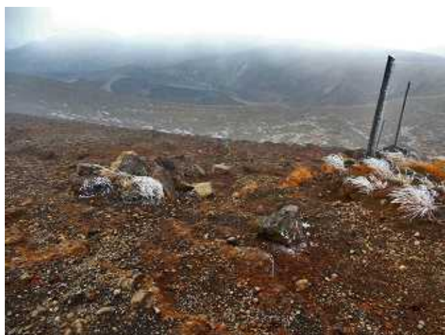
避難小屋付近からの火口(御釜)