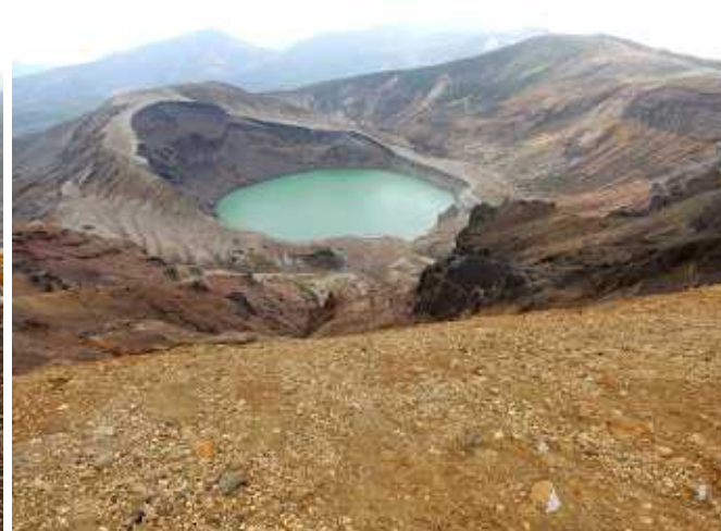
下って行くと御釜が見える