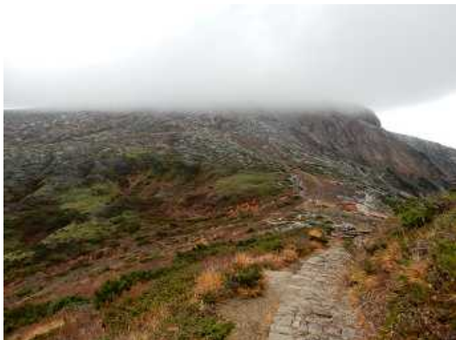
熊野岳方向から雲が巻き上がる