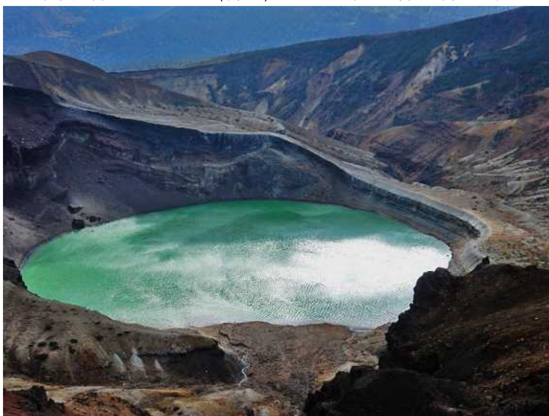
御釜の色は変化して観られる