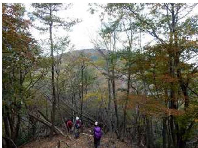
登山道より一山を見る