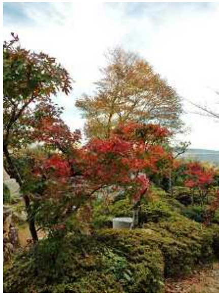
旗 掛 松 の 紅 葉