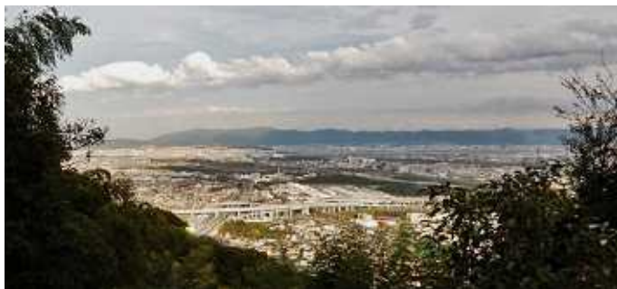
旗掛松展望所より大山崎IC