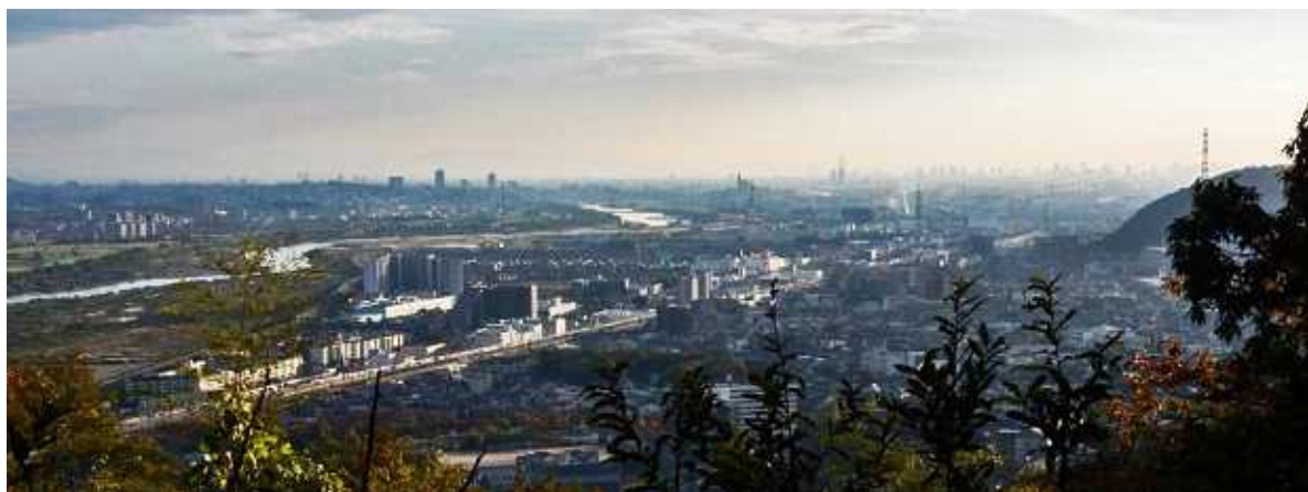
青木葉谷展望台より大阪平野