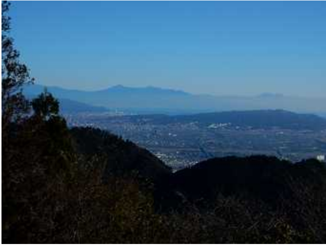
高草山より静岡市街と沼津アルプス