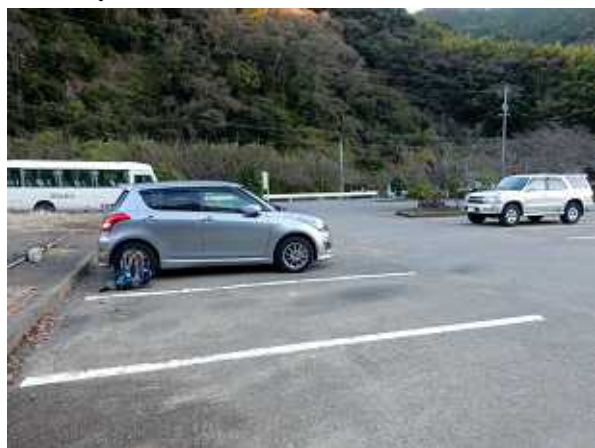
花沢の里観光駐車場

駐車場は到着したとき2台しか停まっていなかったが帰り着いたときは八割方車で埋まっていた。