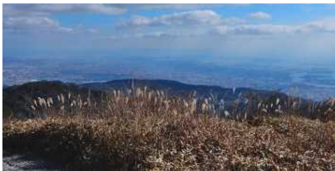
六甲山より大阪湾