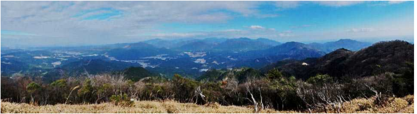
高畑山からのパノラマ