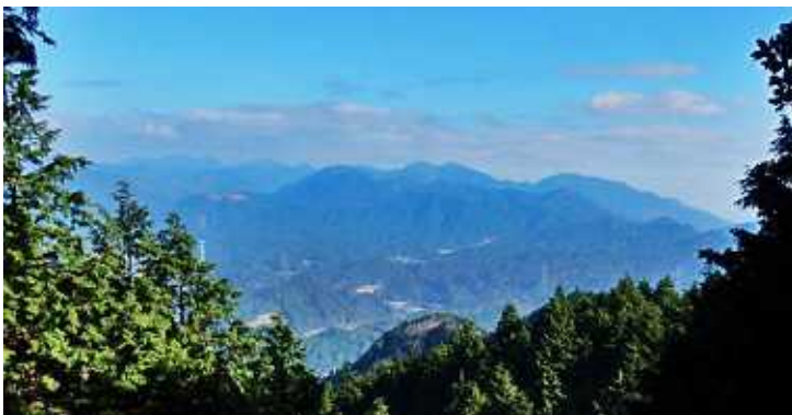
高畑山北尾根より鈴鹿山系