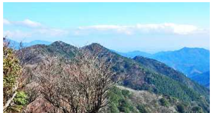
溝干山から高畑山を望む