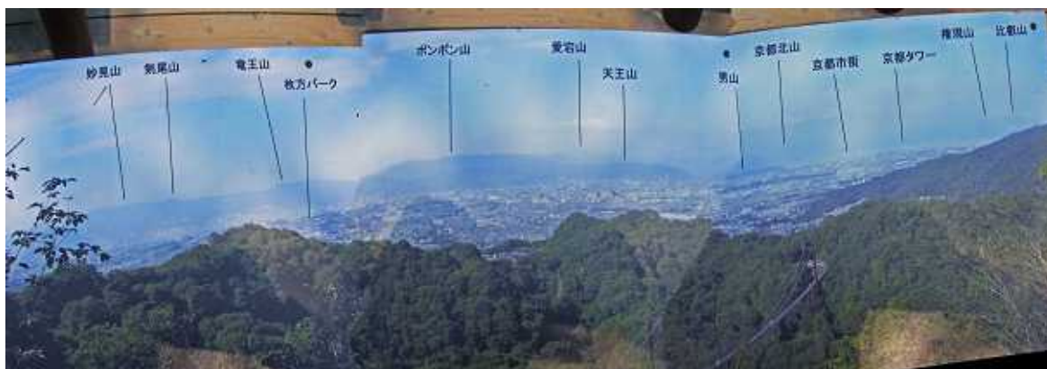
ほしだ園地の展望スポットよりのパノラマと案内板。