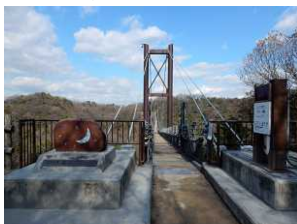
星のブランコ(吊り橋)