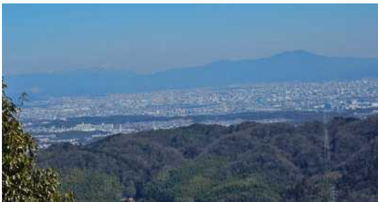
京都市街、左奥には比良山地が望める