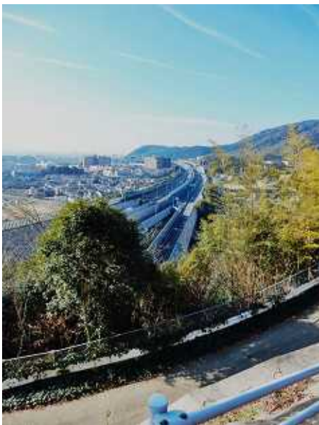
登山口より名神を見下ろす

帰途は釈迦岳から大沢に出てテレビ大阪の中継所より尾根筋を通り水無瀬溪谷に下り尺代より若山神社経由で17時46分自宅に帰着く。