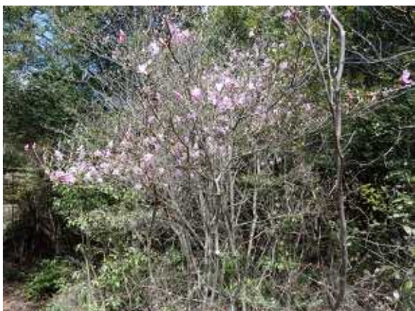
登山道の三つ葉ツツジ