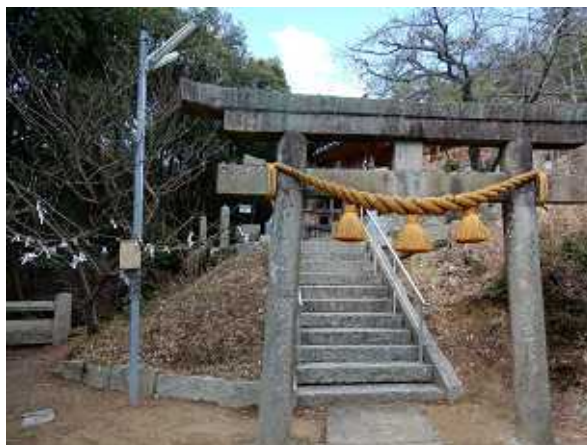
八幡宮上の登山口