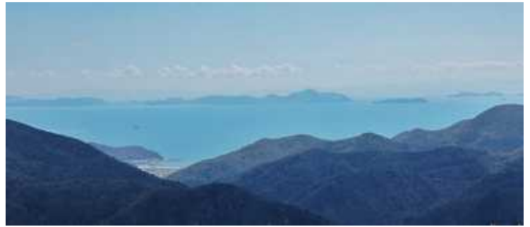
赤穂の沖合 家島群島