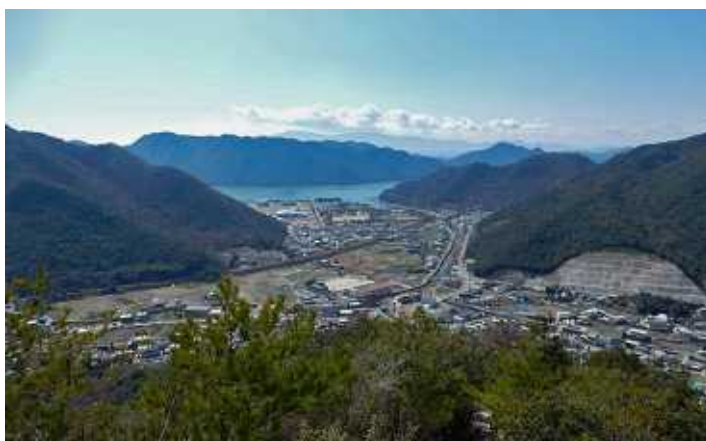
寒河・日生方面を見下ろす