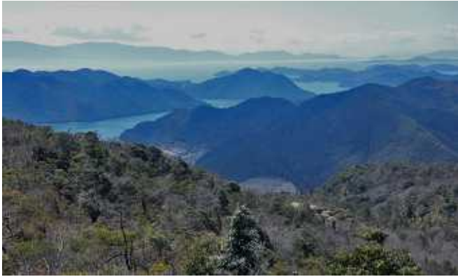
うずあいの瀬戸 遠方の島が小豆島