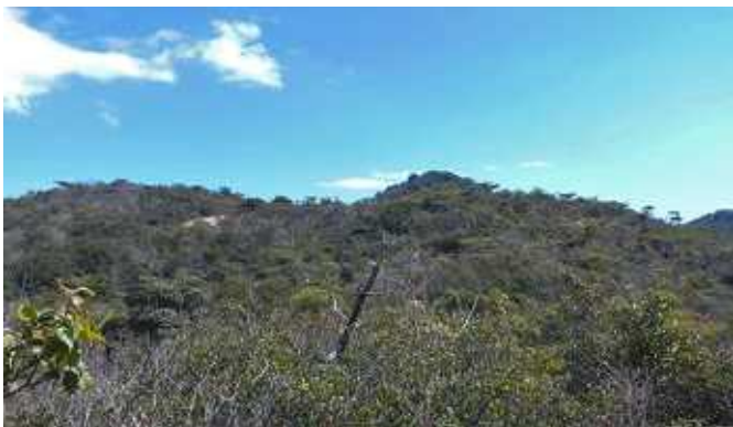
天狗山を振り返る