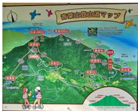
登山道案内マップ