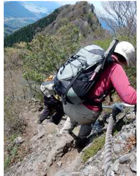
集魂岩をロープ伝いで下る