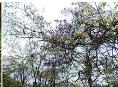
( 道 際 の 花 )