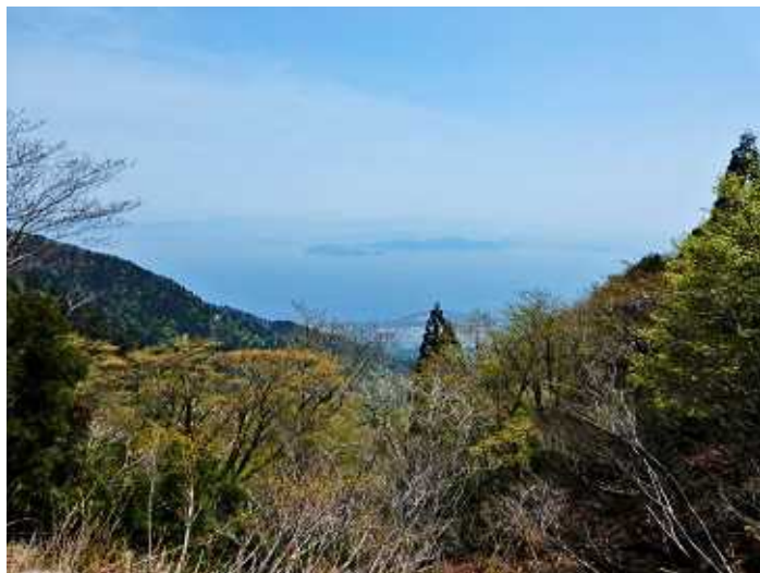
北比良峠から沖ノ島