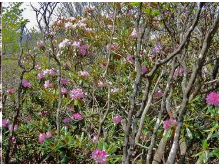
シ ャ ク ナ ゲ