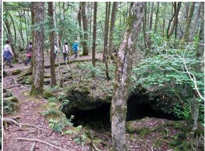
青 木 ヶ 原 樹 海 散 策