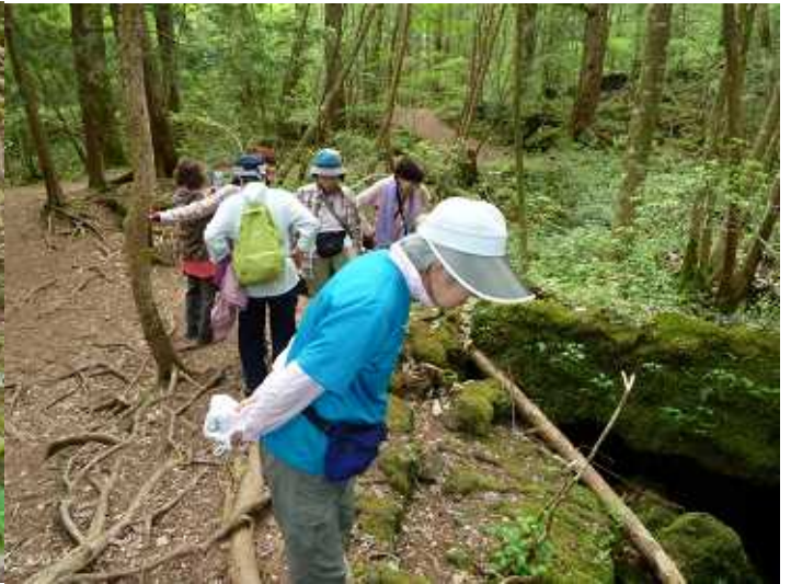
青木ヶ原熔岩洞を覗く