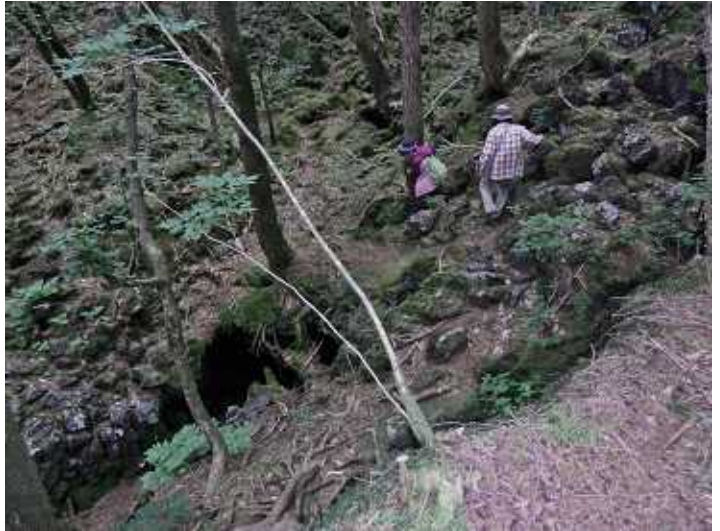
青木ヶ原熔岩洞穴へ