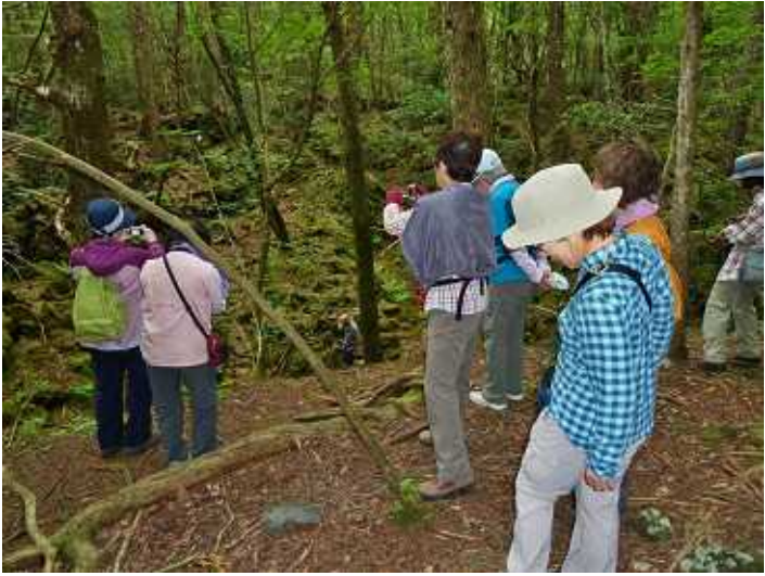
青木ヶ原熔岩洞を覗く

帰途は西湖湖岸沿いに車道を通り民宿に戻り、民宿に挨拶して車で鳴沢氷穴を見に行つて帰途に着く、17時前にJR山科駅に着き解散する。