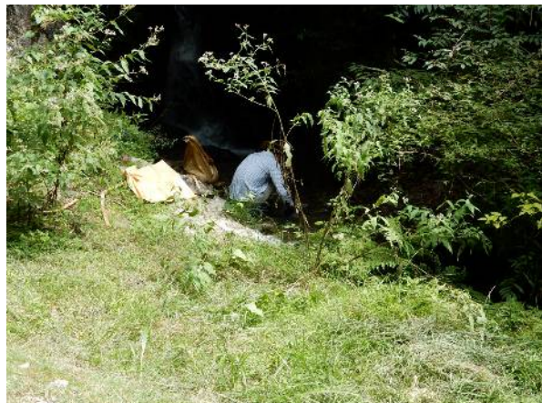
アサギマダラを調査している人