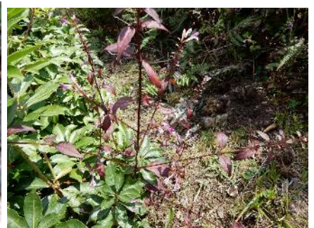
登山道で出会った花