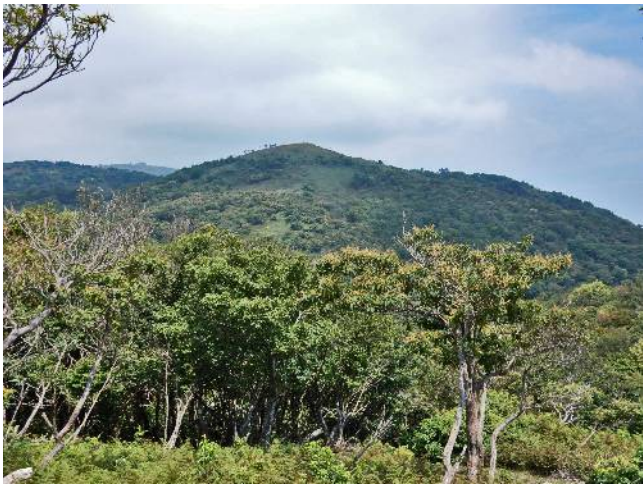
ホツケ山を望む(奥は蓬莱山)