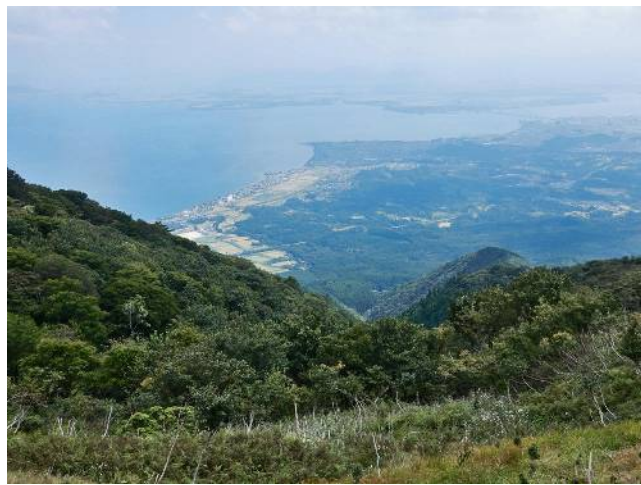
ホツケ山より琵琶湖