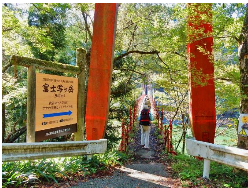
我谷登山口(吊り橋)

ここから一般道を車を置いた駐車場に戻るが、ダム上で下に道があると引き返しダム下の川沿い道に行く途中に枯淵登山口があるが使われている感じはない、橋を渡り富士写湖横の車道を歩いて戻る。