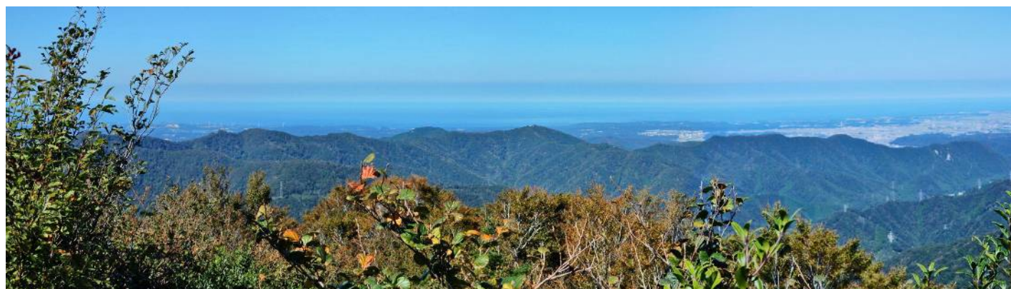
登山道より日本海側の遠望