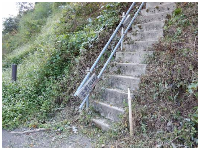
五彩尾根登山口(下山口)