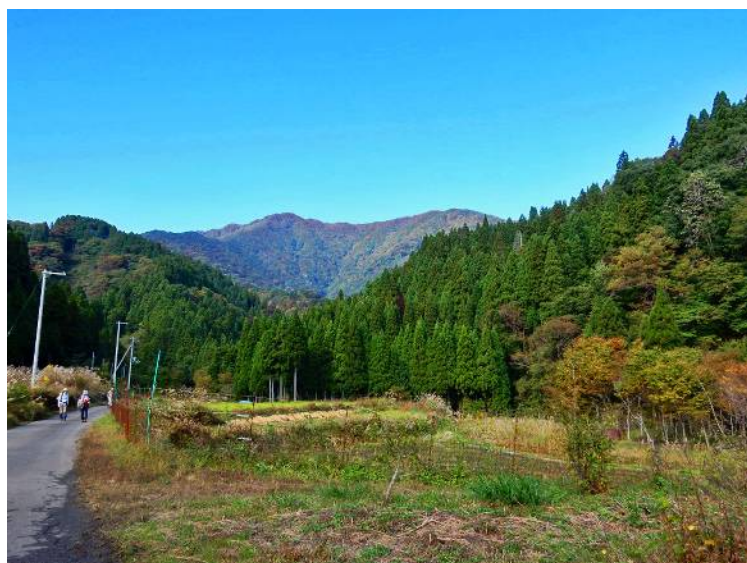
下山道より横山岳