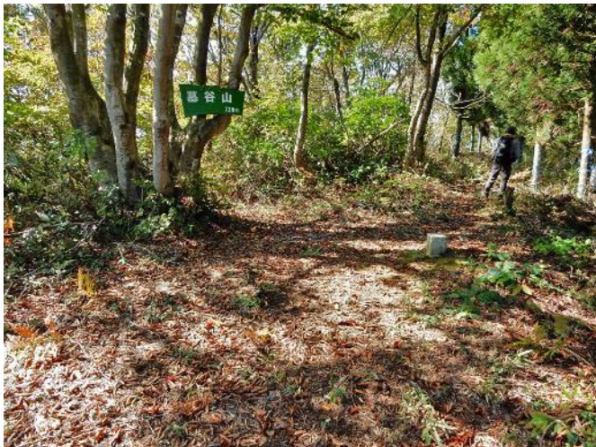
墓 谷 山 山 頂