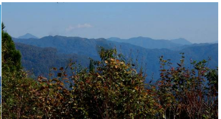
墓谷山より真北76度方面