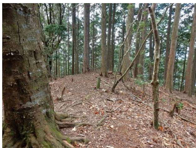
西行者山の山頂(展望なし)