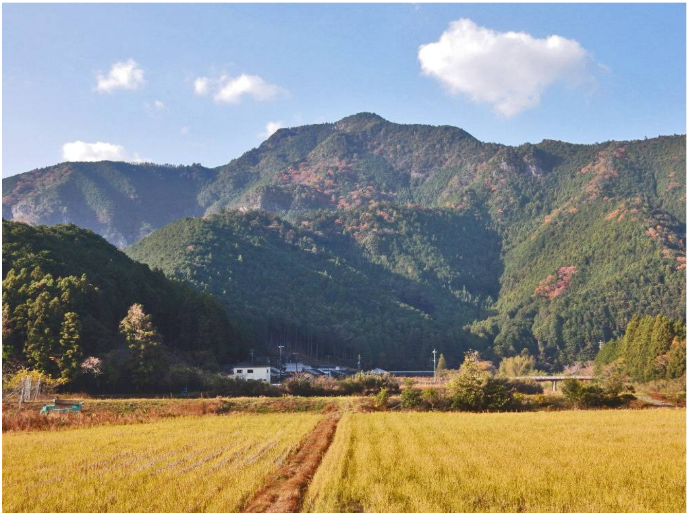
行者山を見上げる