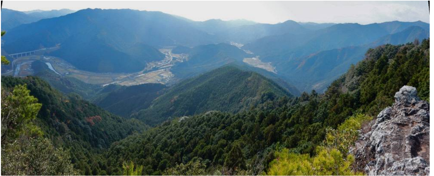
行者山展望岩からのパノラマ