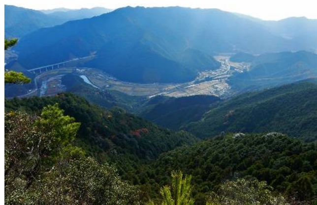
展望岩より大内山駒を見下ろす