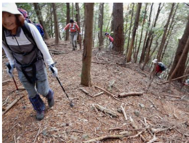
西行者山への登り