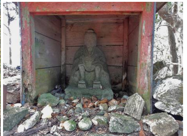
行者山屋代の役行者