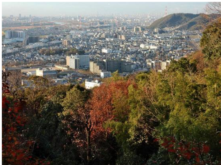
青木葉谷展望所より島本の町