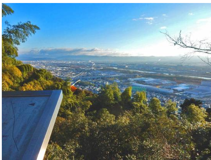
旗立松展望所より京都方面