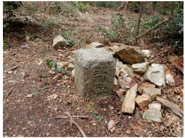
清水山山頂と三角点