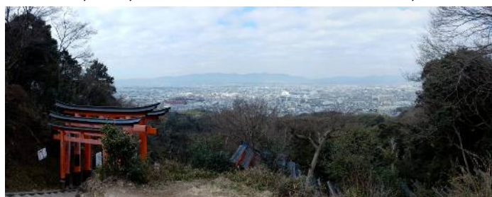
稲荷山参道 からの京都市街